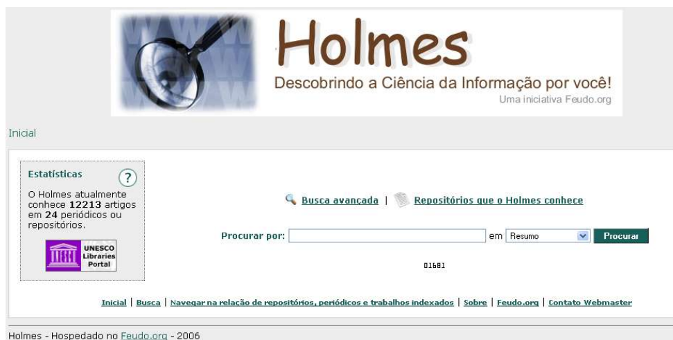
Fig. 2 – Página inicial do Holmes