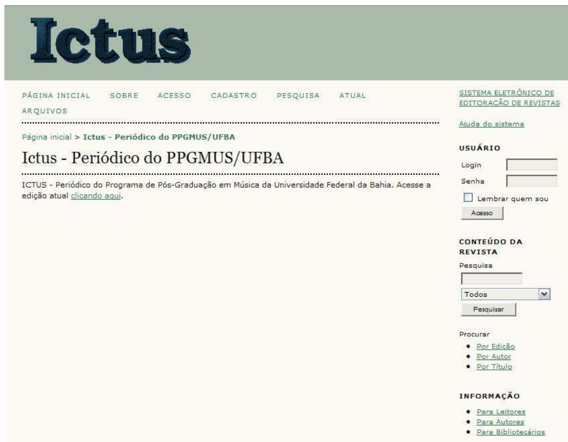
Fig. 3 – Página inicial do Ictus on-line disponível em < http://www.ictus.ufba.br >

Os softwares que possibilitam a existência do Ictus ( Open Journal System ) e do Boetius ( PKP OAI Harvester ) podem ser livremente alterados, copiados e instalados. Os processos de instalação são realizados facilmente, tendo como requisitos uma conta em um servidor web com suporte a linguagem PHP e banco de dados MySQL.