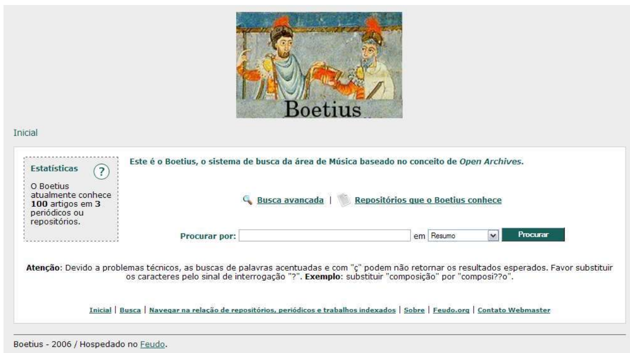
Fig. 4 – Página inicial do Boetius on-line disponível em < http://www.boetius.feudo.org >